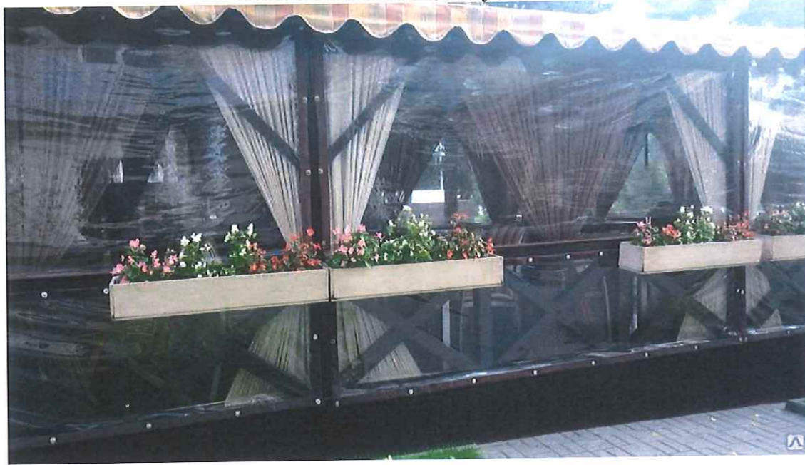
Эскизы объектов для установки